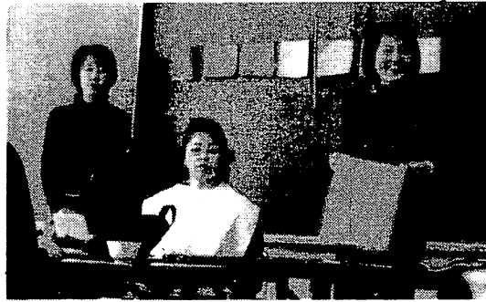
その人に合った色とメイクでより美しく、心ゆたかに

緑Ⅱ判断力・平和・やすらぎ 赤Ⅱ行動力・情熱・よろこび 黄Ⅱ計画力・計算力・健康 紫Ⅱ不安定・高貴・神秘 茶Ⅱ保守性・安定・まじめ (変化を恐れない)