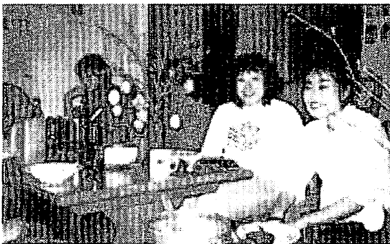
ハンガリー料理のパーティー (寮にて)