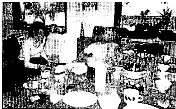
中華料理のパーティー (寮にて)